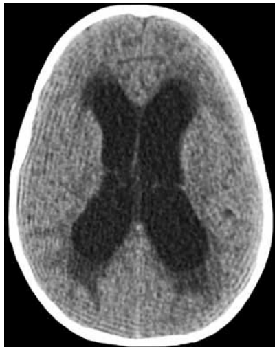
Imagem da tomografia de crânio:

Com relação à conduta inicial, hipótese diagnóstica e conduta a ser tomada imediatamente, assinale a alternativa correta.